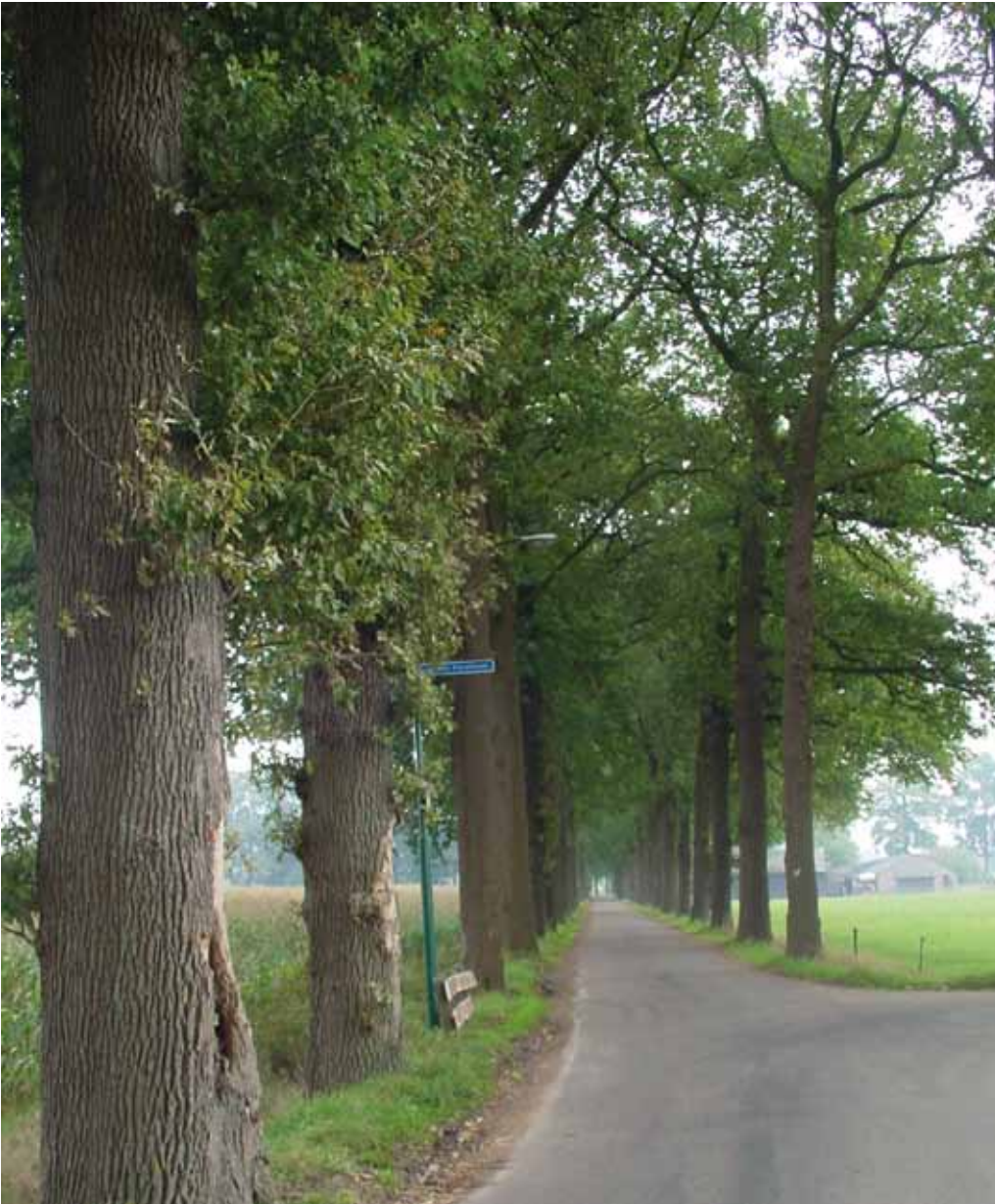
In het buitengebied staan duizenden joekels van bomen, waaronder prachtige eiken van 50 tot 80 jaar oud. Brands: 'Een private overeenkomst waarin je de rekenmethode NVTB vastlegt, voorkomt een gang naar de rechter: als er schade aan bomen ontstaat tijdens het grondroeren, moeten deze volgens de rekenmethode van de NVTB-methode worden vastgesteld en direct door de grondroerder worden betaald.'

mis te gaan, hebben we een bestuurlijk mandaat om het werk direct stil te leggen. De aannemer moet dan maatregelen nemen voordat hij verder mag werken. Als hij dat niet doet, kost hem dat alleen maar geld.'